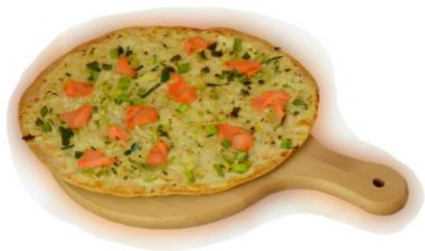
Flammkuchen Lachs & Lauch

...mit Pastinake, Süßkartoffel, Spinat, Ziegenkäse, Tomatenmarmelade, Schmand, Rucola